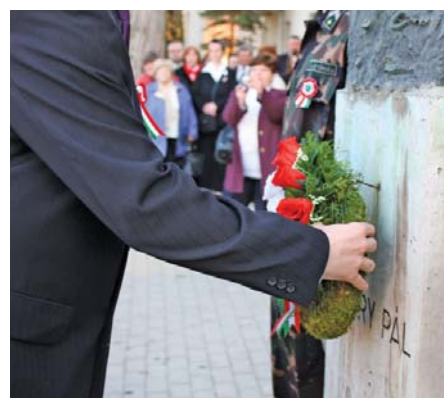
Az iskola előtt található Nyáry Pál szobor koszorúzása

Ezekről a fogalmakká vált szavakról minden magyar embernek ugyanaz jut eszébe: legnagyobb nemzeti ünnepünk, az 1848. március 15-ei szabadságharc. Ezen a napon egy maroknyi fiatal „írás-tudó” elindított egy lavinát, amely megváltoztatta a nép életét. Erőt adott akkor, és erőt ad azóta is minden tavasszal, hogy higgyünk magunkban, és legyünk büszkék magyarságunkra.