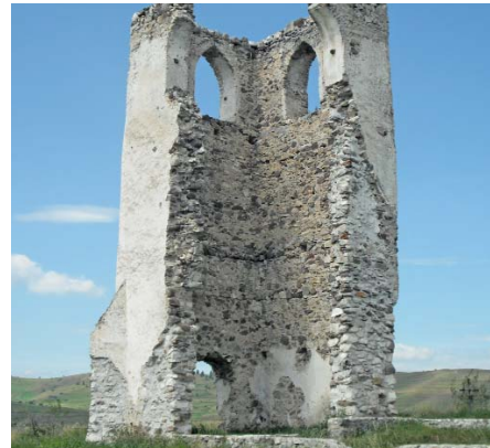
Csíkszenttamási Csonka torony

A csíksomlyói búcsú már nem csak a hitről, a pünkösdről, Mária tiszteltéről szól, hanem a szétszakított magyarság egységét, összetartozását is hirdeti