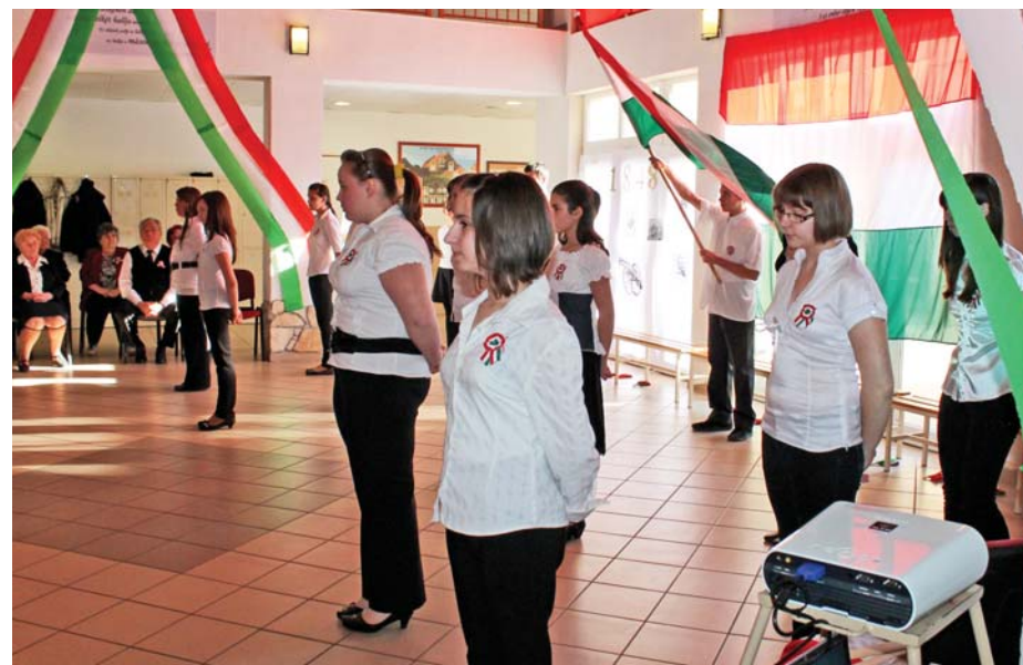
A diákok ünnepi műsora

A történelmi események sodrása, és a hozzájuk kapcsolódó fogalmak mindannyiunk számára ismertek: Kokárda, Nemzeti Dal, Tizenkét pont, Landerer nyomdája, Pilvax, Nemzeti Múzeum, Petőfi, Kossuth, Táncsics, Nyáry Pál, forradalom... és szabadság.